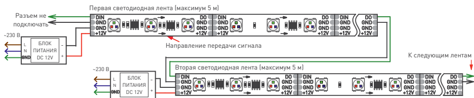
Рис. 1. Схема подключения ленты без использования внешнего контроллера [максимум 1024 пикселя, общий рисунок динамического эффекта при переходе с ленты на ленту сохраняется]