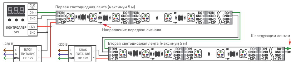
Рис. 2. Схема подключения ленты при управлении от внешнего контроллера