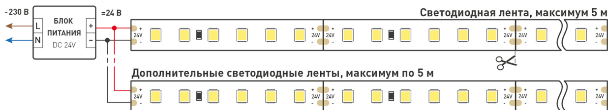
Схема 1. Подключение нескольких светодиодных лент с одной стороны.

Максимальная длина подключения ленты – 5 м (1 катушка).